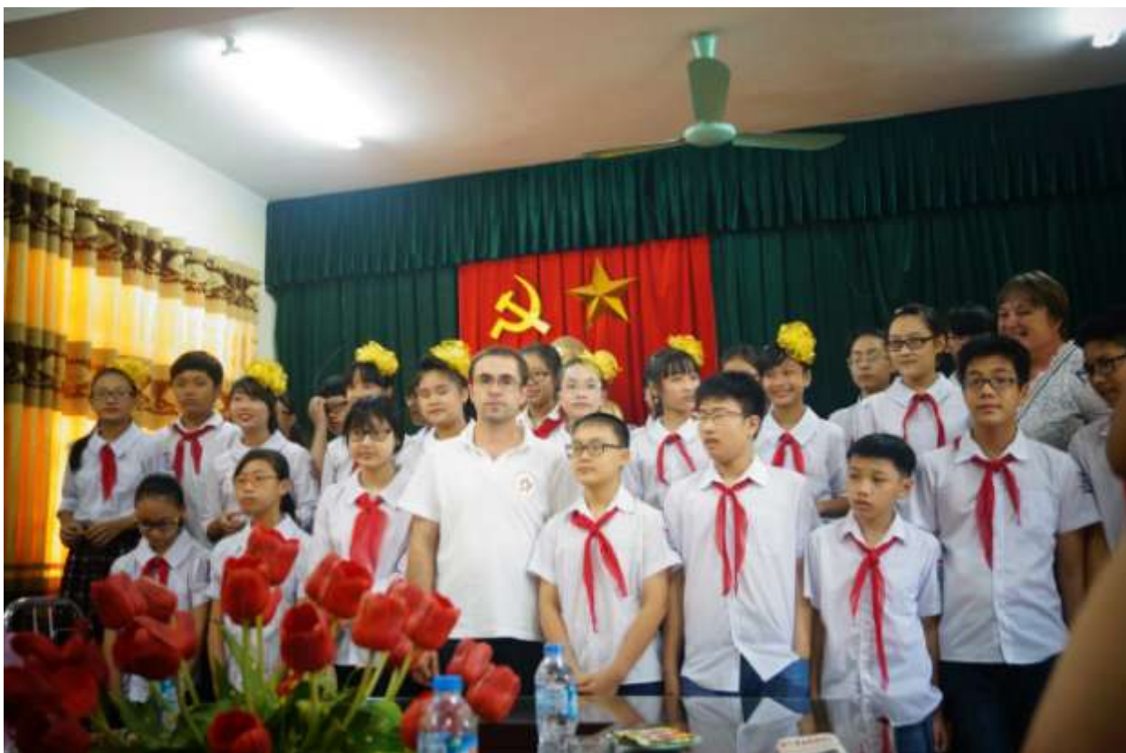
Встреча пионеров России и Вьетнама в школе г. Винь-Фук