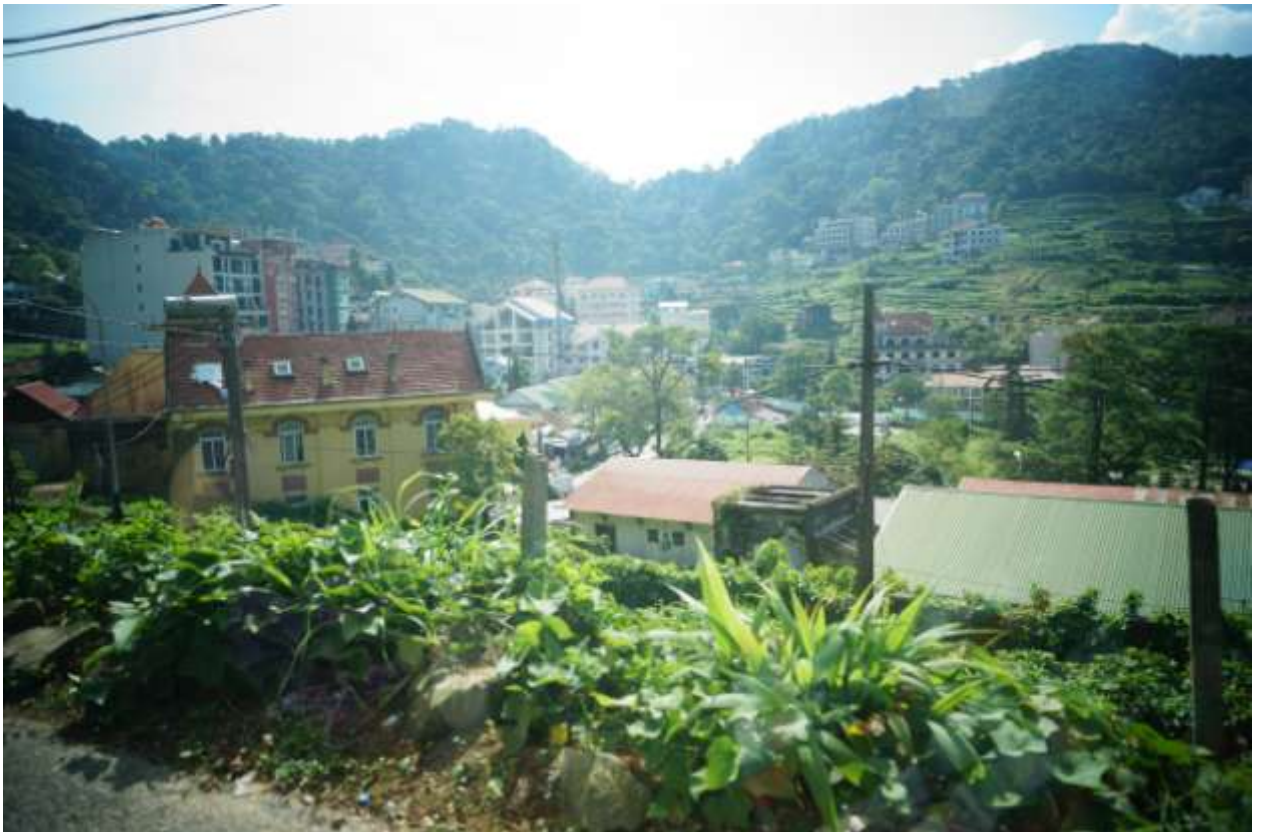
Вид из окна нашей гостиницы в г. Винь-Бинь