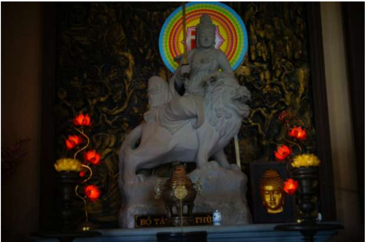
Посещение храма в г. Ханой