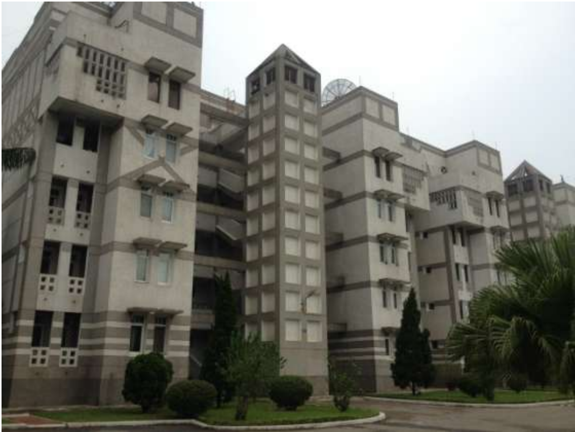
Российское Посольство в г. Ханой