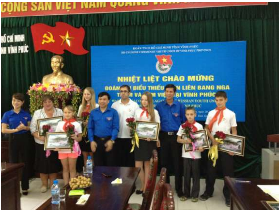
Наше представительство в г. Винь-Фук