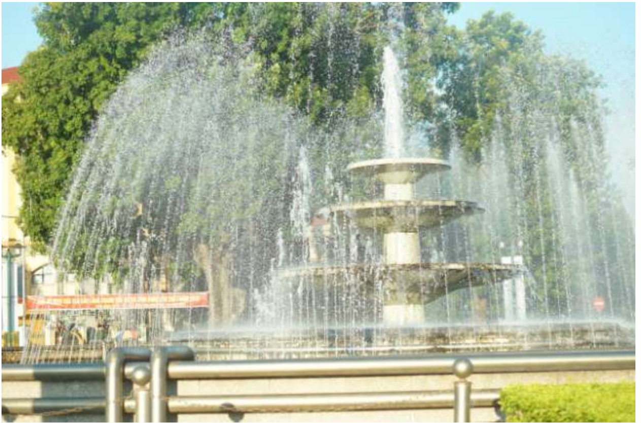
Центральный фонтан в г. Ханой