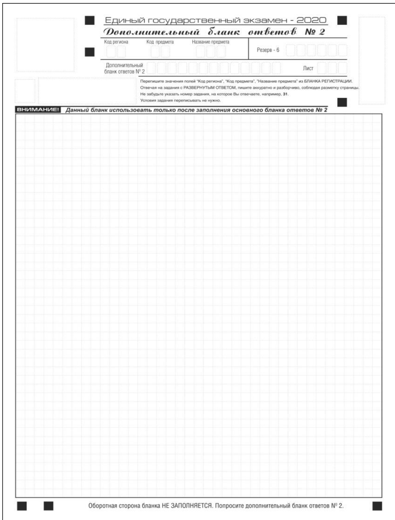
Рис. 15. Дополнительный бланк ответов № 2